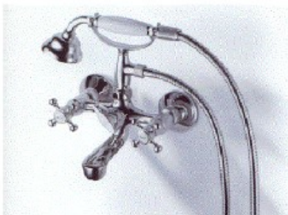
Vanhan mallinen sekoitin