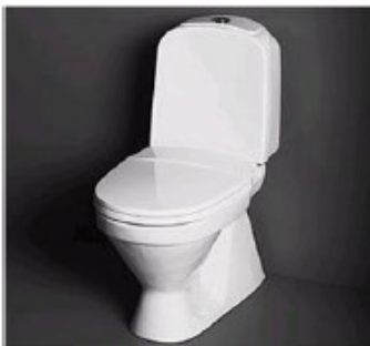
WC:n jatkuva vuoto