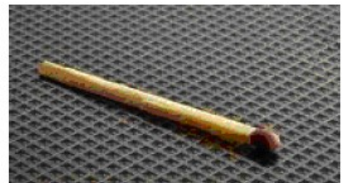
Tulitikku 3.000 m 3 / vuosi = 14 190,00 €