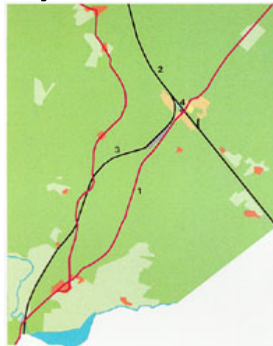
Hyvinkää vuonna 1890