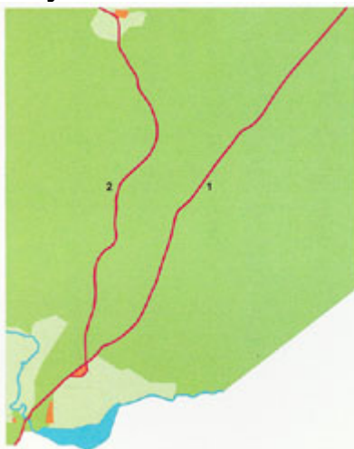
Hyvinkää vuonna 1850

Viimeisintä vaihetta asutuksen laajenemisessa edustaa loma-asutus erämaaselänteiden järvien rannoille, joilla sijaitsee useita lomakylätyyppisiä vapaa-ajan yhdyskuntia, kuten Sääksjärven ympäristö, Sykäri, Keravanjärvi ja Usmin alue.