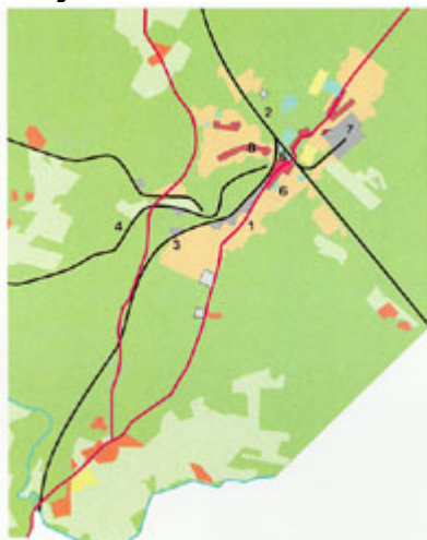
Hyvinkää vuonna 1940