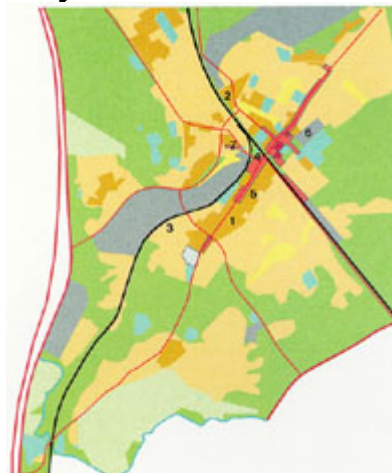
Hyvinkää vuonna 1990