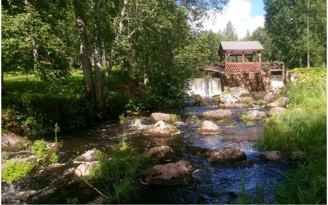
Kuva 2. Sahakoski ja Koskenmaan pato Keravanjoen latvaosissa Hyvinkäällä.