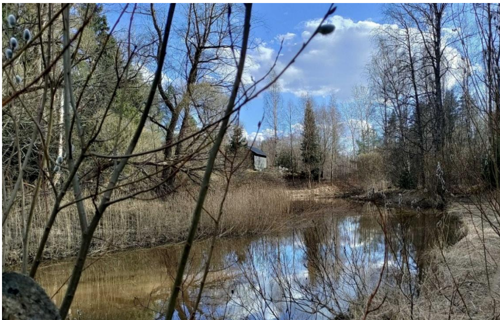
Kuva 1. Ohkolanjoen alaosaa maaliskuussa 2026.

Yhdeksi suurimmista huolenaiheista kaikissa tilaisuuksissa nousi jokien kuivuus. Yhä useammin vedenpinnat ovat liian alhaalla, mikä heikentää sekä jokien luonnon tilaa että virkistyskäyttöä. Kuivuvat penkat sortuvat herkästi ja uomaerosio joessa on kiihtynyt. Lisäksi kuivuus ja mm. veden lämpötilan nousu herättivät huolen kalojen elinoloista.